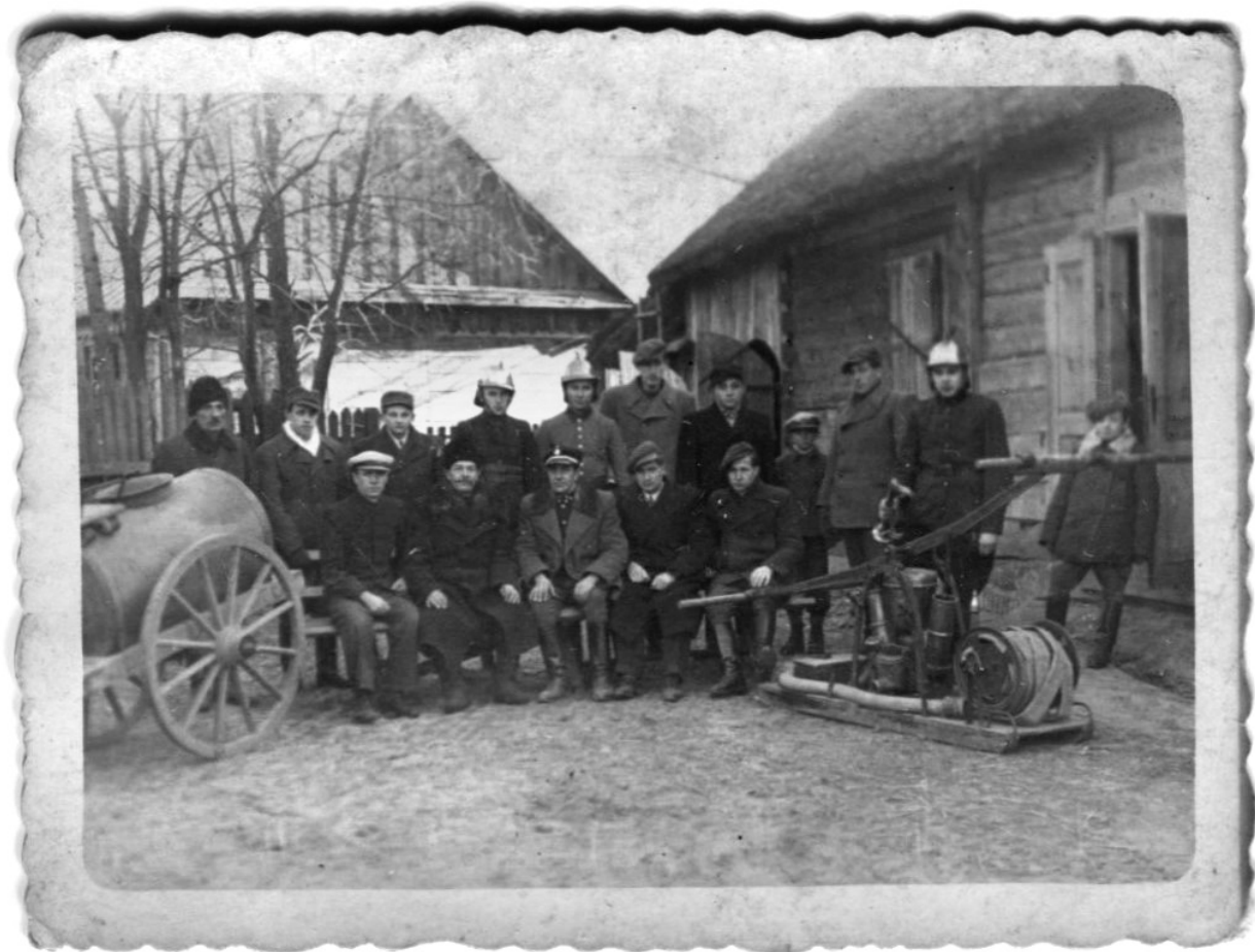
Il. 3. Członkowie OSP Siemień z lat 30. XX wieku.

fundusze z kolejnych przedstawień Koło zakupiło dodatkowo wóz pod sikawkę, wiadra i inne narzędzia strażackie 88 . W 1927 r. Zarząd Wojewódzki Głównego Związku Straży Pożarnych RP w Lublinie 89 przekazał dla straży 30 m węża 90 . Koszty węża w 50% miał pokryć wójt z budżetu gminy Siemień, a 50% Związek Wojewódzki Straży Pożarnych. W tym samym roku Zarząd Okręgowego Związku Straży Pożarnych RP w Radzynie Podlaskim 91 przekazał 5 toporków, 5 pasów bojowych i 1 linkę. Przed 1927 r., lub w tym roku, strażacy sposobem gospodarczym wykonali beczkę na wodę oraz wóz do przewozu sikawki i beczki. Dodatkowo zarządca majątku Siemień Jerzy Czarkowski wyznaczył jedną parę koni z wozem, która miała się