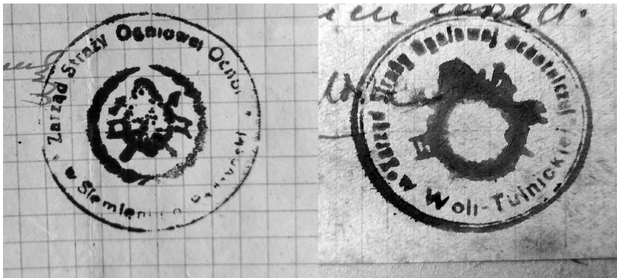
Il. 1. Pieczętki OSP Siemień i OSP Wola Tulnicka.

Na początku 1935 r. został wprowadzony nowy statut wzorowy dla Ochotniczych Straży Pożarnych, z czym wiązała się ponowna rejestracja straży według nowych przepisów 36 . Na posiedzeniu Zarządu Oddziału Powiatowego Związku Straży Pożarnych R.P. w Radzynie Podlaskim w dniu 28 kwietnia 1935 r., na mocy upoważnienia Zarządu Okręgu Wojewódzkiego Związku Straży Pożarnych R.P. w Lublinie z dn. 8 III 1935 r., do Oddziału Powiatowego zostały przyjęte 23 straże pożarne, w tym OSP Siemień i OSP Wierchowiny 37 . Wymogiem przyjęcia było złożenie podania wraz z wypełnionymi i podpisanymi przez