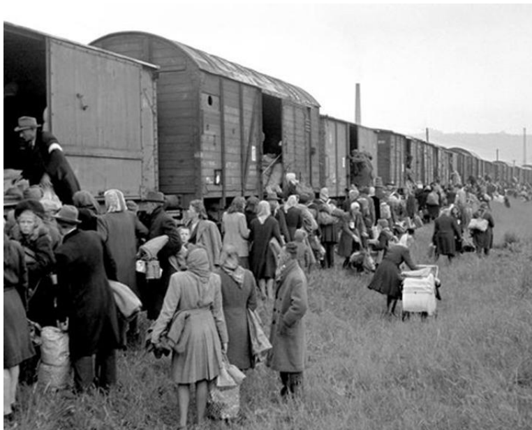
Fig.1. Deportacja Niemców na Syberię (fot. Bjleslawy Julinej, 2016 r.)

Obecnie skala i tempo migracji znacznie się zmniejszyły. Następuje stopniowe przywracanie zapomnianych i utraconych tradycji kulturowych, zwyczajów, języka, świąt i codziennych cech życia Niemców rosyjskich. Istnieje tendencja do odradzania się tradycji etnokulturowych, o czym świadczą bliskie i trwałe związki z państwem niemieckim, nie tylko z ośrodkami kulturalnymi Niemców rosyjskich, ale także z poszczególnymi rodzinami niemieckimi. Głównym celem Niemców rosyjskich, jak każdego innego narodu na ziemi, jest przetrwanie jako narodu.