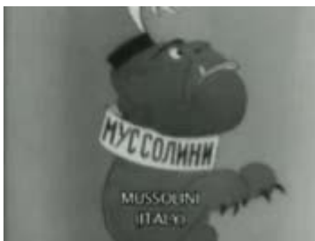
Rys. 11. Kadr z filmu Adolf treser psów i jego milusińscy (z prawej strony)