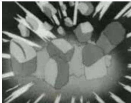
Rys. 17. Kadry z filmu Pozbądź się wroga na pierwszej linii i w domu [w:] Kronika Filmowa...