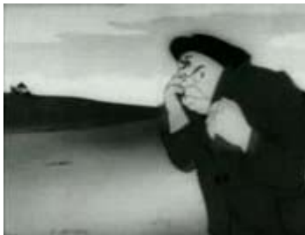
Rys. 16. Kadr z filmu Pozbądź się wroga na pierwszej linii i w domu [w:] Kronika Filmowa... (z lewej strony)