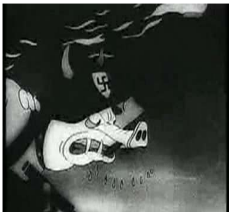
Rys. 8. Kadr z filmu Bucyory faszystów depczą naszą ojczyznę , reż. A. Iwanow, I. Wano, Sojuzfilm (z prawej strony)