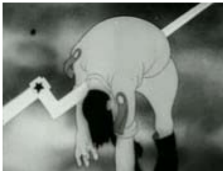
Rys. 15. Kadr z filmu Ziemia dla ziemiaństwa [w:] Kronika filmowa... (z prawej strony)