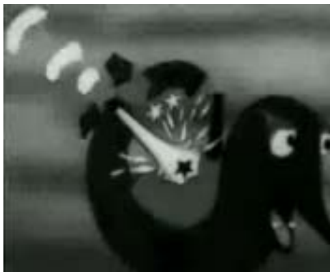
Rys. 14. Kadry z filmu Pokonać faszystowskich piratów .