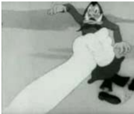
Rys. 7. Kadr z filmu Pozbądź się wroga na pierwszej linii i w domu [w:] Kronika Filmowa... (z prawej strony)