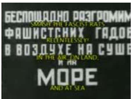
Rys. 13. „Zmiażdżyc faszystowskie szczury. Bezlitośnie! W powietrzu, na lądzie i na morzu”. Kadr z filmu Pokonać faszystowskich piratów [w:] Kronika Filmowa... (z prawej strony)