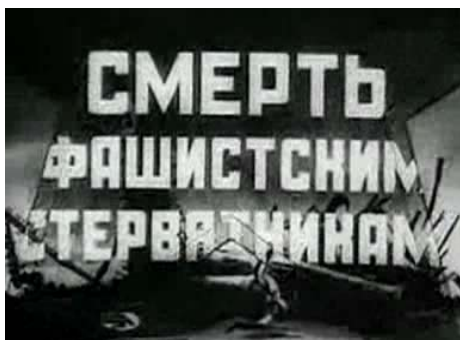
Rys. 12. „Śmierć faszystowskim sępom”. Kadry z filmu Sępy (z lewej strony)