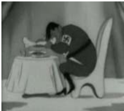
Rys. 6. Kadr z filmu Adolf treser psów i jego milusińscy [w:] Kino-cyrk... (z lewej strony)