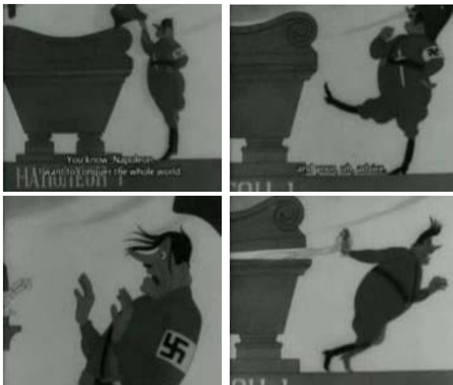
Rys. 2. Kadry z filmu Adolf i Napoleon [w:] Kino-cyrk...

W przemówieniu z 7 listopada 1941 roku Stalin wspominał postacie historyczne, m.in.: Aleksandra Newskiego, Dimitrija Pozcharskiego i Michała Kutuzowa 14 – osoby ściśle związane z sukcesami wojennymi imperialnej Rosji. Zabiegi te, podobnie jak w poprzednim przypadku, miały służyć podkreśleniu ciągłości historycznej zróżnicowanego kulturowo i etnicznie państwa, które w czasach swojej imperialnej przeszłości odnosiło liczne sukcesy na arenie międzynarodowej 15 .