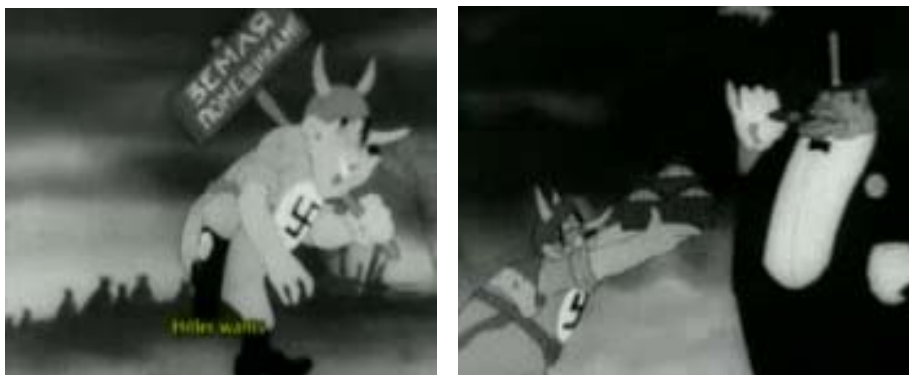
Rys. 4. Kadry z filmu Ziemia dla ziemiaństwa [w:] Kronika filmowa...

W referatach Stalina z listopada 1941 roku można odnaleźć wątki pozwalające na określenie ich jako elementy propagandy totalitarnej. Arendt wskazuje, że nadrzędną właściwością propagandy totalitarnej jest skierowanie jej przesłania „na zewnątrz, nie zależnie czy będą to nietotalitarne warstwy własnego społeczeństwa, czy też nietotalitarne państwa ościenne” 20 . Do zewnętrznego czynnika propagandy stalinowskiej można zaliczyć bezpośrednie odniesienia do intelektualistów, którzy niegdyś napiętnowani, teoretycznie uzyskują teraz status społeczny równy chłopom i robotnikom. Przekaz ten miał również innego odbiorcę – pozostałe państwa europejskie. Krajom, które zostały zaatakowane przez Hitlera, Stalin tłumaczył, że niejednorodność społeczeństwa niekomunistycznego jest przyczyną niezdolności do odparcia ataku nazizmu. To z kolei stanowiło analogiczną wskazówkę dla pozostałych państw – można odeprzeć faszyzm, wprowadzając komunizm.