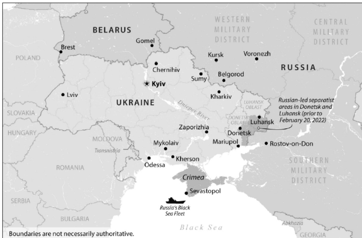
Rysunek 4. Secesyjne terytoria ukraińskie

Do wschodnich obwodów Ukrainy stopniowo przerzucano i rekrutowano dywersantów rosyjskich, którzy podniecali nastroje separatystyczne, inkorporacyjne i stawali się liderami grup zdobywających agendy władz obwodowych. Na początku kwietnia 2014 roku w Doniecku (jako pierwszym mieście, 6 kwietnia), Ługańsku, Charkowie i kilku pomniejszych miastach takie grupy szturmowały budynki władz ukraińskich. Grupy te były umundurowane i uzbrojone w sprzęt strzelecki. Warto zwrócić uwagę, że wyposażenie pochodziło tylko z Rosji. Zdecydowaną część agend władz obwodowych zdobyto, domagając się referendum oraz pomocy od Rosji. Podkreślenia wymaga, że bojownicy nie mieli oznaczeń przynależności państwowej oraz byli dobrze nastawieni wobec ludności miejscowej. Ponadto pod kątem zasad użycia siły byli reaktywni, to znaczy, że używali ognia tylko w warunkach bezpośredniego zagrożenia. 11 kwietnia Ukraina ogłosiła operację antyterrorystyczną, a 15 kwietnia w Słowiańsku rozpoczęły się pierwsze działania mające na celu ustabilizowanie sytuacji we wschodniej Ukrainie 34 .