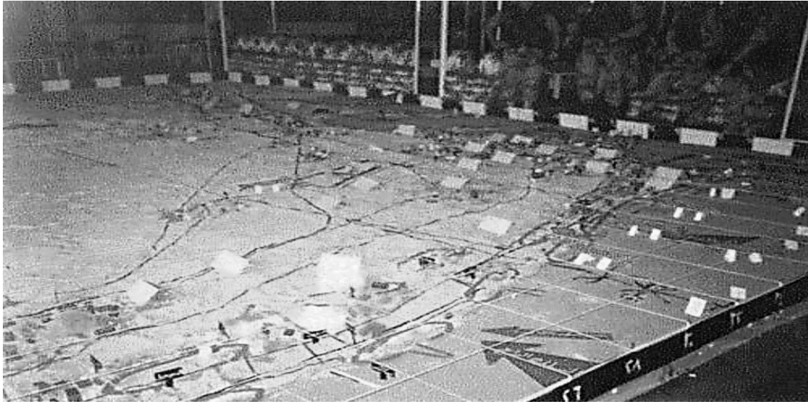
Rysunek 2. Irakijska gra wojenna, widoczna ocena zagrożenia desantu morskiego

Przytoczony przykład z historii sztuki wojennej dobitnie pokazuje możliwość uzyskania zaskoczenia poprzez wykorzystanie znajomości oceny zagrożenia przeprowadzonej przez przeciwnika oraz zastosowanie dezinformacji. Ta ostatnia nie tylko w tym przykładzie jest obecna i zapoczątkowała rozwój teorii sztuki wojennej. Dezinformacja była szczególnie popularnym narzędziem uzyskania zaskoczenia w czasie II wojny światowej. Stała się również jedną z inspiracji do opracowania procedury dla poziomu operacyjnego do dezinformowania. Natomiast zasada Magrudera znalazła świetne odzwierciedlenie w wydarzeniach mających miejsce na Półwyspie Arabskim. Wzmocniono błędną ocenę zagrożenia i przeprowadzono działania zupełnie z innego kierunku. Współcześnie na polskim gruncie rozwijane są procedury sztabowe inspirowane zasadą Magrudera na poziomie taktycznym 24 .