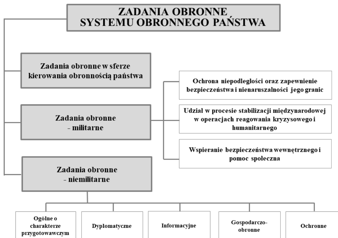
Rysunek 5. Klasyfikacja zadań obronnych Systemu Obronnego Państwa według kryterium rodzaju

Źródło: M. Kuliczkowski, Przygotowanie obronne w Polsce... , op. cit., s. 55.