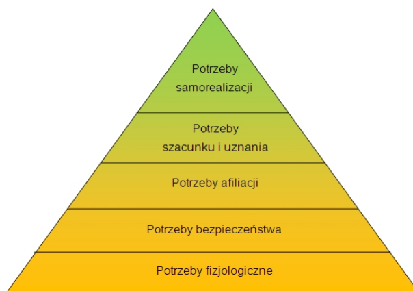
Rysunek 2. Tabela Potrzeb A.H. Masłowa

Następnym sposobem definiowania terminu bezpieczeństwo jest przedstawianie go, jako nadrzędnej potrzeby, celu, motywu oraz wartości 3 . Według teorii Masłowa bezpieczeństwo jest podstawową potrzebą człowieka. Według tej teorii zaspokojenie wyższych potrzeb jest możliwe tylko wówczas, gdy potrzeby niższego szczebla są już osiągnięte 4 . Dążenie do zapewnienia i utrzymania bezpieczeństwa na przestrzeni dziejów było i nadal jest aktualną aktywnością człowieka. Pierwotnie człowiek zmagał się z niebezpieczeństwami środowiska naturalnego, co zmotywowało go do doskonalenia technik i narzędzi obronnych. Obecnie zaspokojenie bezpieczeństwa jest zadaniem jednostki, państwa oraz instytucji międzynarodowych.