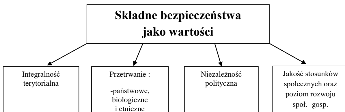
Rysunek 3. Składne bezpieczeństwa, jako wartości