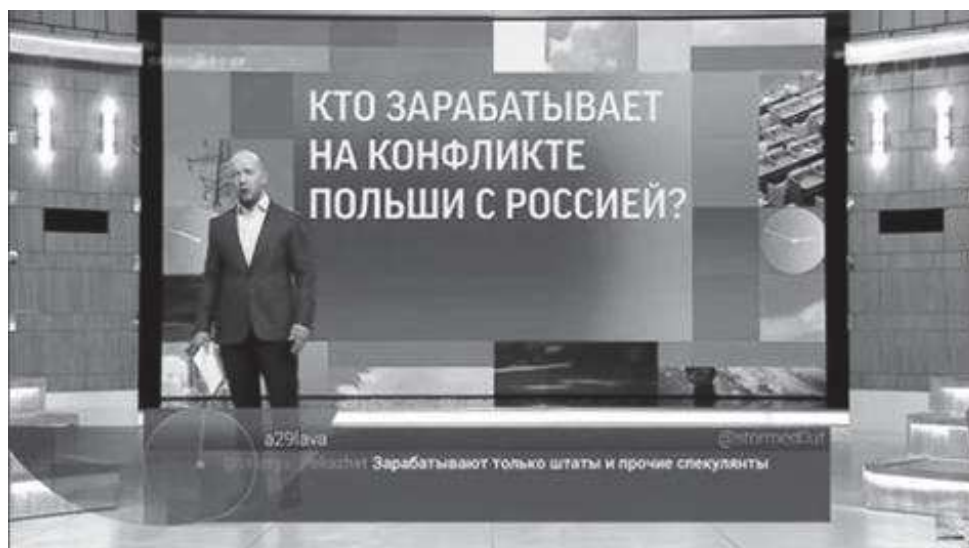
Rysunek 3. Jeden z kadrów programu. Pytanie do publiczności: „Kto zarabia na konflikcie Polski z Rosją”. Wydanie 06.07.2017. Źródło: Print screen, https://www.youtube.com/watch?v=C5wcNOoqE88