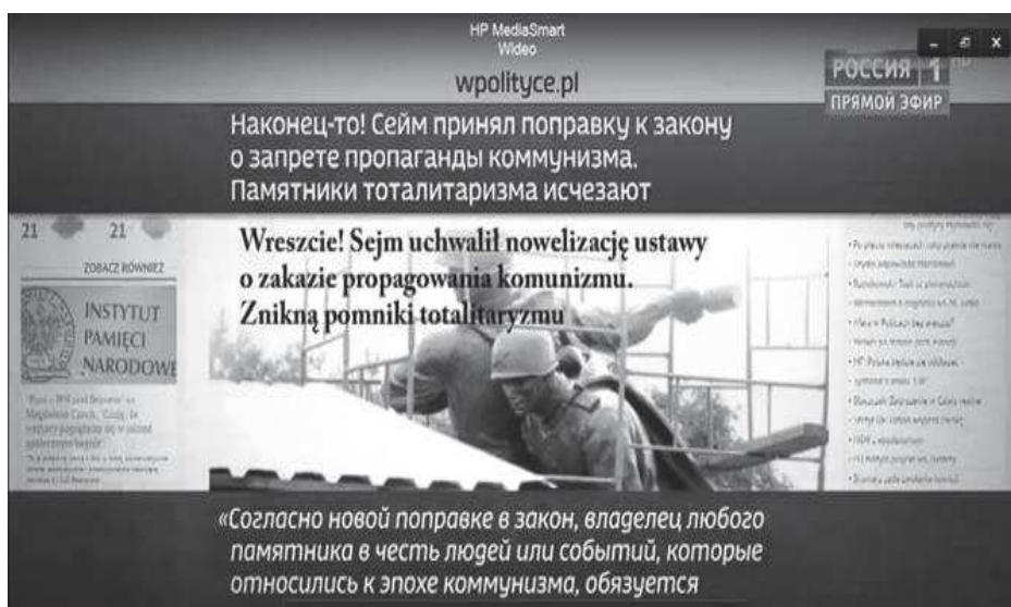
Rysunek 5. Kadr z programu telewizyjnego „60 minut” Wydanie 03.07.2017.