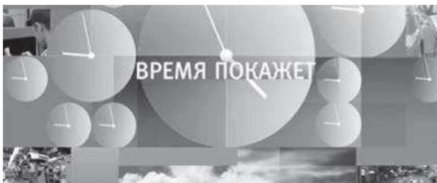
Rysunek 1. „Время покажет” – czołówka programu, wydanie 06.07.2017.

Program „Czas pokaże” jest to polityczno-społeczne show emitowane od 2014 roku, którego tematyka dotyka bieżących spraw omawianych przez ekspertów: polityków, politologów, dziennikarzy 10 . Program otrzymał prestiżową nagrodę telewizyjną TEFI w kategorii „Najlepsze dzienne talk-show” w październiku 2017 roku 11 .