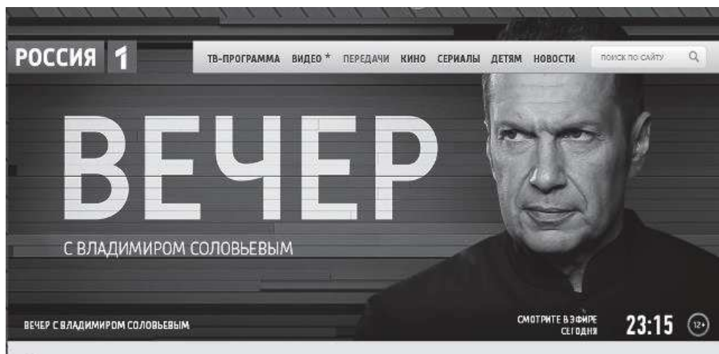
Rysunek 6. Czołówka programu „60 minut”